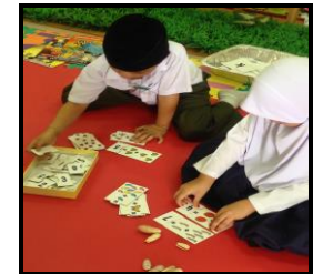
Belajar melalui permainan